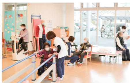
武蔵ヶ丘通所リハビリテーション