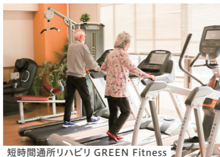
短時間通所リハビリ GREEN Fitness