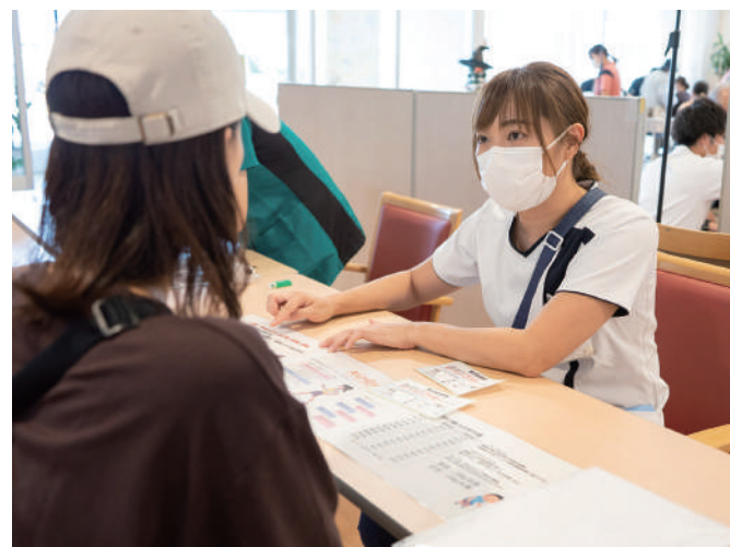
リハビリ総合説明・相談