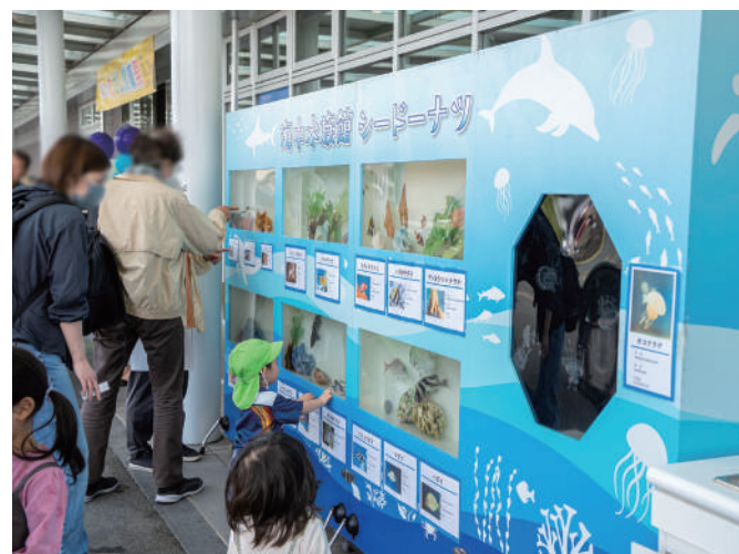
移動水族館（シードーナツ）