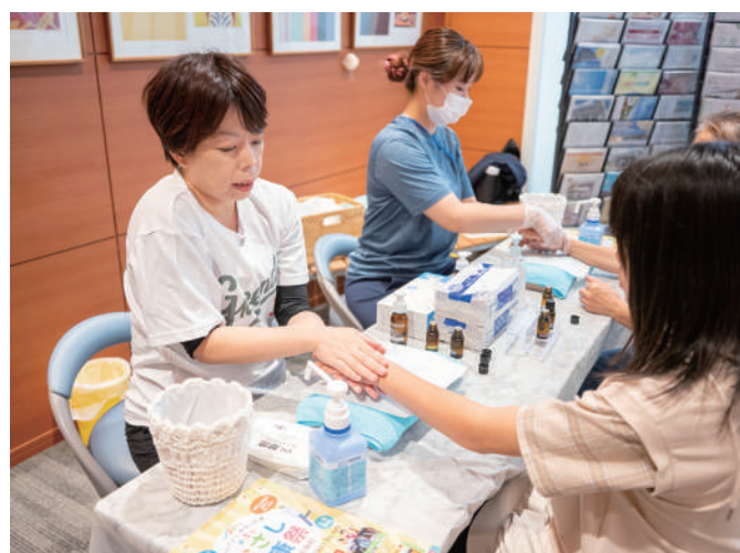
ハンドマッサージ