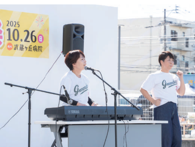
音を楽しむ会・コグニサイズ