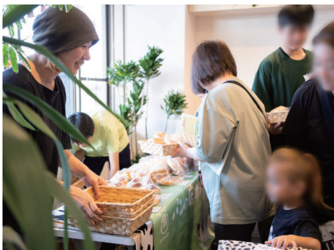
パン販売（カリメロ）