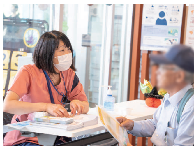
禁煙相談・睡眠相談