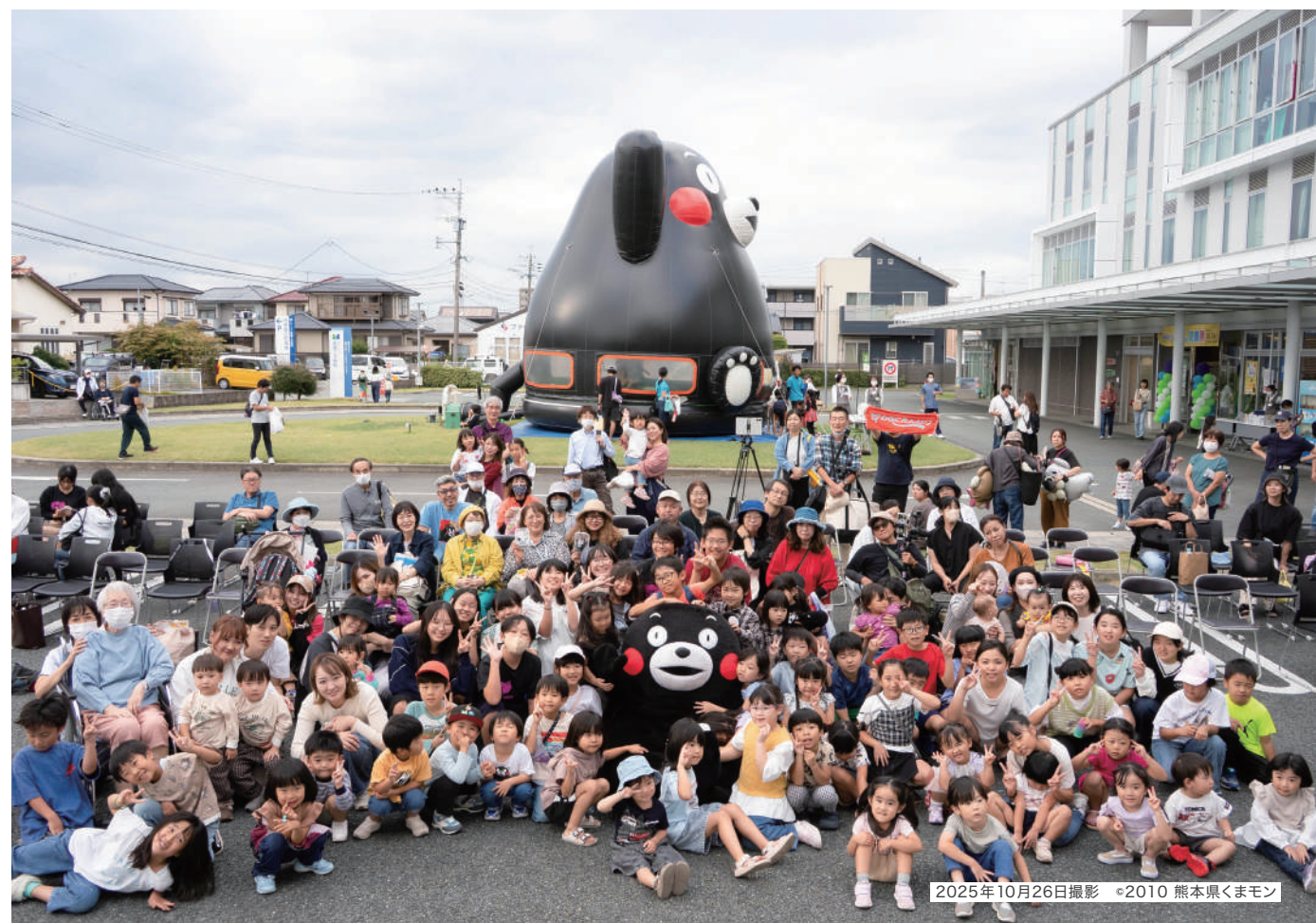
2025年10月26日撮影 ©2010 熊本県くまモン