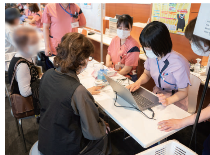
血管年齢・ストレス測定