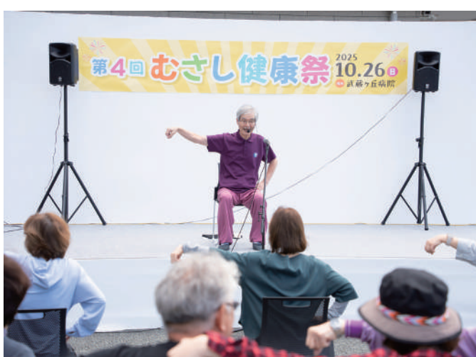
太極拳ゆったり体操