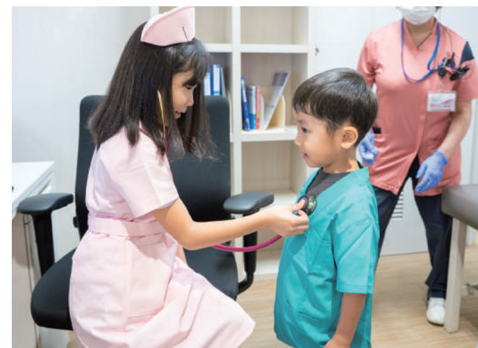
病院のお仕事体験