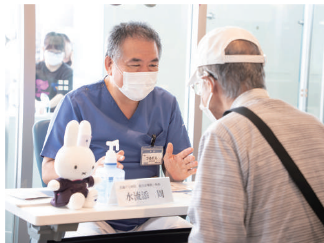
医師への健康相談