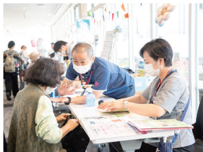
ケアマネジャーへの介護相談