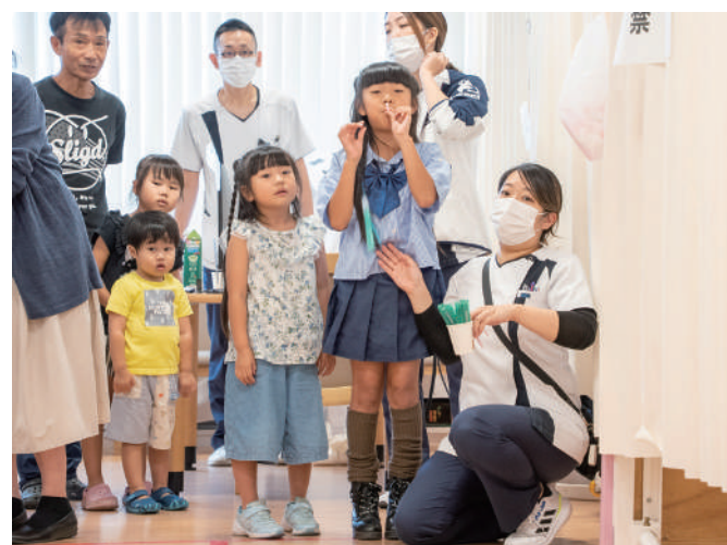
飲み込み・発声チャレンジブース