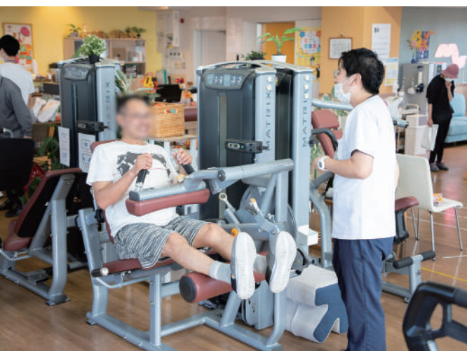
トレーニングマシン体験