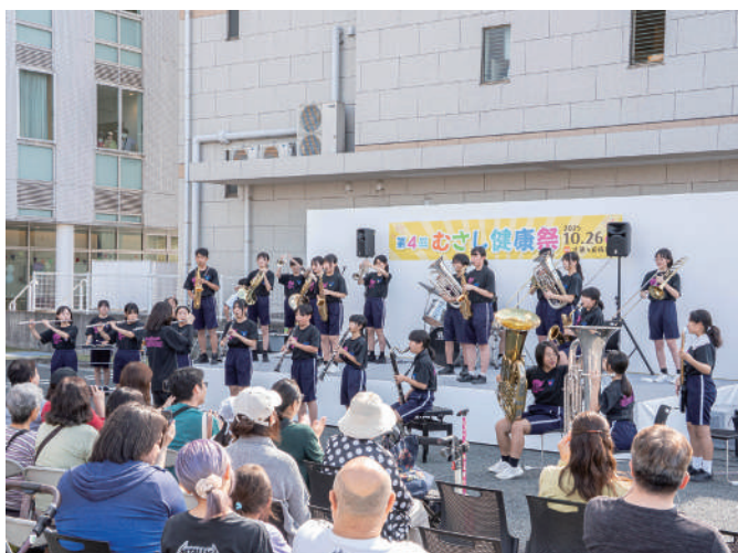
楠中学校吹奏楽部演奏