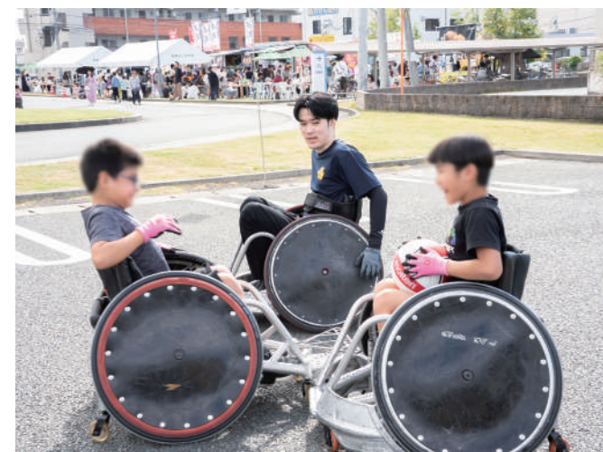
車いすラグビー体験