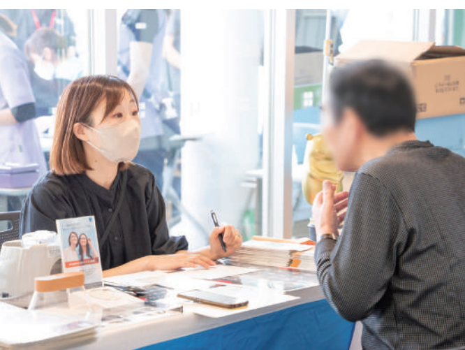
めがね・補聴器体験