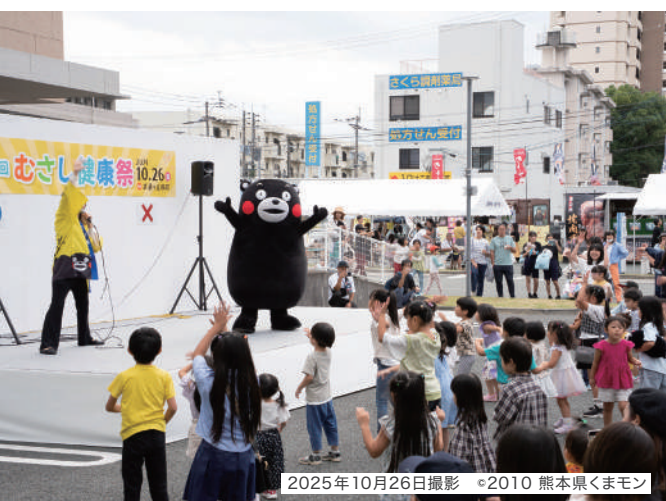
くまモンとクイズ大会