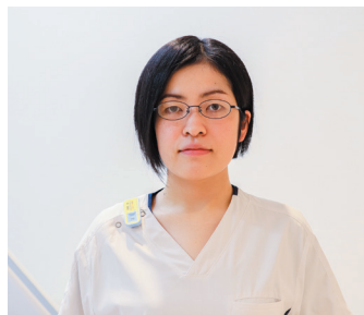
放射線部 古城診療放射線技師