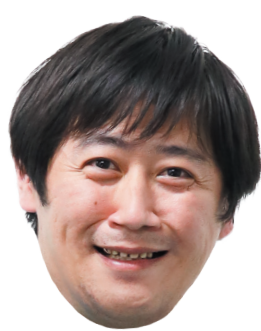
看護小規模多機能ホームむさし 介護福祉士

今年が卯年。今回は今年、年男・年女を迎えた職員の中からピックアップした10名に今年の抱負を述べていただきました！